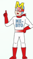
神奈川県のキャラクター 未病改善ヒーローミビョーマン