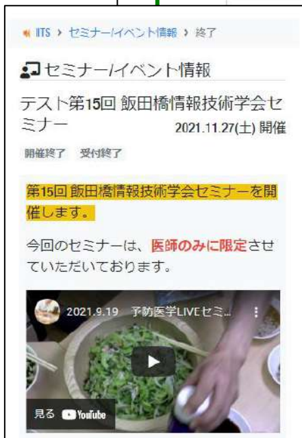
・会員マイページでの映像配置例